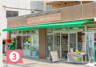
3 生活クラブのぼりとデポー

生鮮食品も充実。小麦の郷という手作りパンコーナーも併設。外で食べるのにちょうどいいパンやおやつなどを買い込み、さらに歩みを進めます。