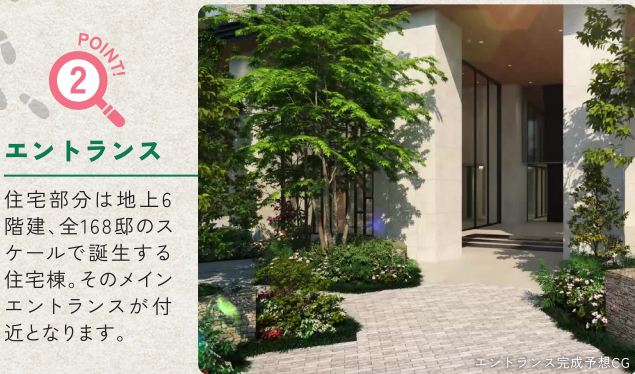
エントランス完成予想CG

住宅棟南西側は穏やかで潤い豊かな五ヶ村堀緑地に隣接。多くの住戸をこの緑道沿いとする配棟計画です。