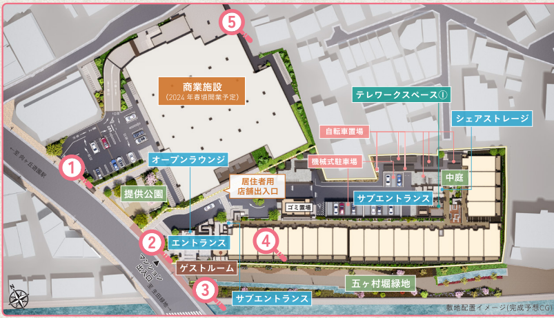
敷地配置イメージ(完成予想CG)

「向ヶ丘遊園」駅南口より徒歩4分。賑わいある街並みを抜けたその先に、新たな街のシンボルを目指した商住一体開発プロジェクトとして、本物件は誕生します。