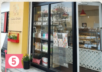
5 ココナッツドリーム

その後は現地にて本プロジェクトのスケールをご体感ください。現地周辺は五ヶ村堀緑地をはじめ、お散歩コースにふさわしい穏やかで落ち着いた環境が広がっています。