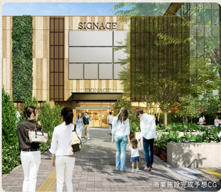
商業施設完成予想CG