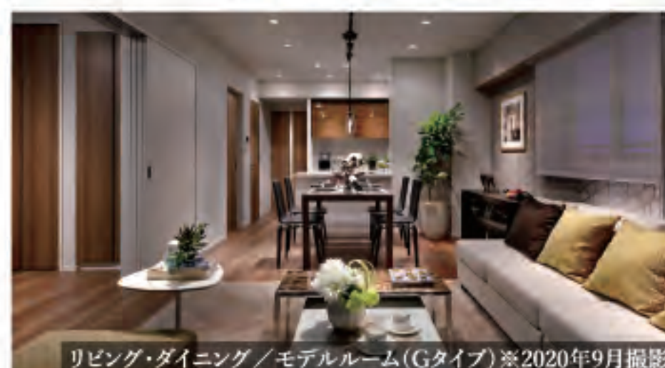
リビング・ダイニング / モデルルーム(Gタイプ) ※2020年9月撮影

資料や公式ホームページでは分からない、お部屋の解放感や、野村不動産のこだわりを感じてみてください。